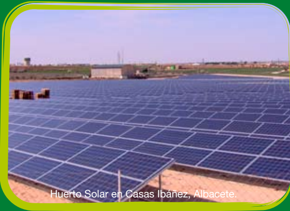
Huerto Solar en Casas Ibáñez, Albacete.